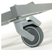
Centrální nožní brzda nebo 4 brzditelná otočná kolečka