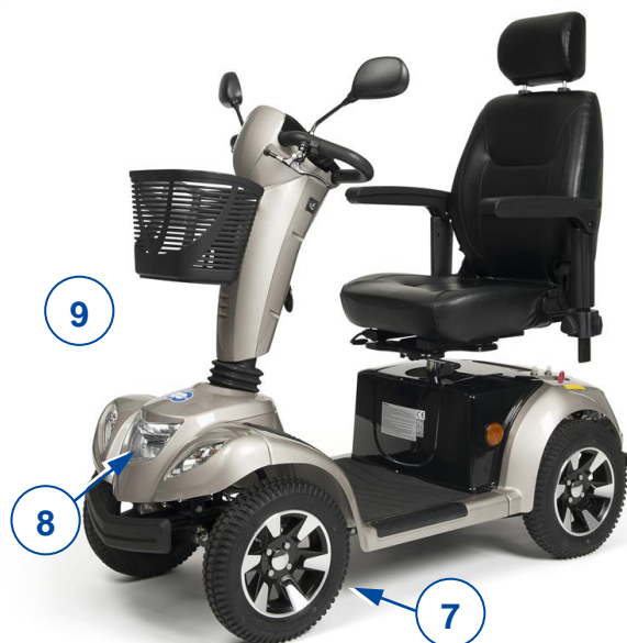
Carpo 4, Carpo 4D