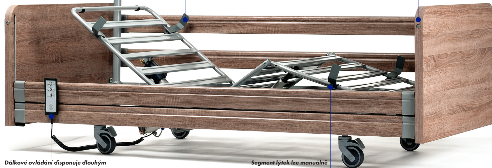
Dálkové ovládání disponuje dlouhým prodlužovacím kabelem, aby jej bylo možné umístit kdekoli na lůžko.