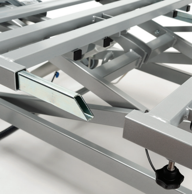
Snadné rozložení lůžka bez potřeby nářadí