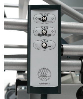
Dálkový ovladač s funkcemi zámku