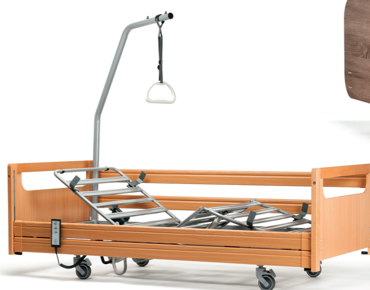
4 polohovací zarážky matrace (2 v hlavové části a 2 v nožní části) udržují matraci v dokonalé poloze.